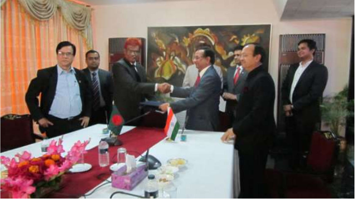
বিগত ১২ ফেব্রুয়ারি, ২০১৬ তারিখে ঢাকায় অনুষ্ঠিত ভারত-বাংলাদেশ যৌথ কমিটির ৬২তম বৈঠক শেষে বৈঠকের সম্মত কার্যবিবরণী বিনিময়।