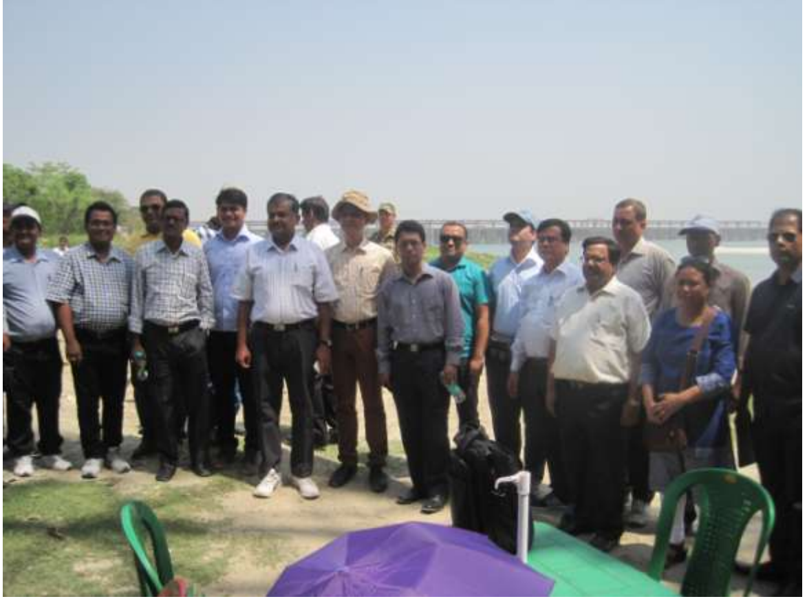
বিগত ১২ এপ্রিল, ২০১৬ তারিখে ভারত-বাংলাদেশ যৌথ কমিটির প্রতিনিধিদল কর্তৃক ভারতের ফারাক্কা ব্যারেজের ভাটিতে গঙ্গা নদীর প্রবাহ পরিমাপ সাইট পরিদর্শন।