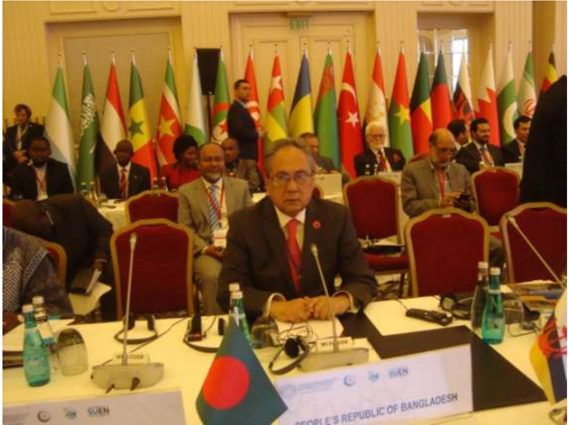
তুরস্কের ইস্তাম্বুলে OIC ভূক্ত দেশসমূহের পানি সম্পদ মন্ত্রীদের তৃতীয় সভায় বক্তব্য রাখছেন বাংলাদেশের পানি সম্পদ মন্ত্রী ব্যারিস্টার আনিসুল ইসলাম মাহমুদ, এম পি (মার্বো)

গত ১৭-১৯ মে, ২০১৬ খ্রিঃতারিখে তুরস্কের ইস্তাম্বুলে OIC ভূক্তদেশসমূহের পানি সম্পদ মন্ত্রীদের তৃতীয় সভায় পানি সম্পদ মন্ত্রণালয়ের মাননীয় মন্ত্রী ব্যারিস্টার আনিসুল ইসলাম মাহমুদ, এমপি বাংলাদেশ প্রতিনিধি দলের নেতৃত্ব প্রদান করেন। সভায় মাননীয় পানি সম্পদ মন্ত্রী তাঁর বক্তৃতায় পানি সম্পদ ক্ষেত্রে বাংলাদেশের অগ্রগতির সার্বিক চিত্র তুলে ধরেন।