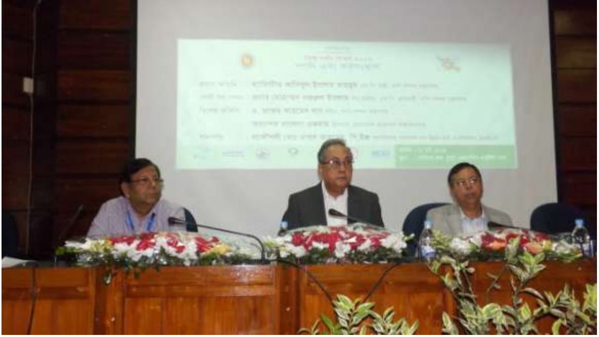
BANCID কর্তৃক বিশ্ব পানি দিবস উপলক্ষে আয়োজিতকর্মশালায় প্রধান অতিথির বক্তব্য প্রদান করছেন পানি সম্পদ মন্ত্রী ব্যারিস্টার আনিসুল ইসলাম মাহমুদ, এম পি (মার্বো)

গত ১৭-১৯ মে, ২০১৬ খ্রিঃতারিখে তুরস্কের ইস্তাম্বুলে OIC ভূক্তদেশসমূহের পানি সম্পদ মন্ত্রীদের তৃতীয় সভায় পানি সম্পদ মন্ত্রণালয়ের মাননীয় মন্ত্রী ব্যারিস্টার আনিসুল ইসলাম মাহমুদ, এমপি বাংলাদেশ প্রতিনিধি দলের নেতৃত্ব প্রদান করেন। সভায় মাননীয় পানি সম্পদ মন্ত্রী তাঁর বক্তৃতায় পানি সম্পদ ক্ষেত্রে বাংলাদেশের অগ্রগতির সার্বিক চিত্র তুলে ধরেন।