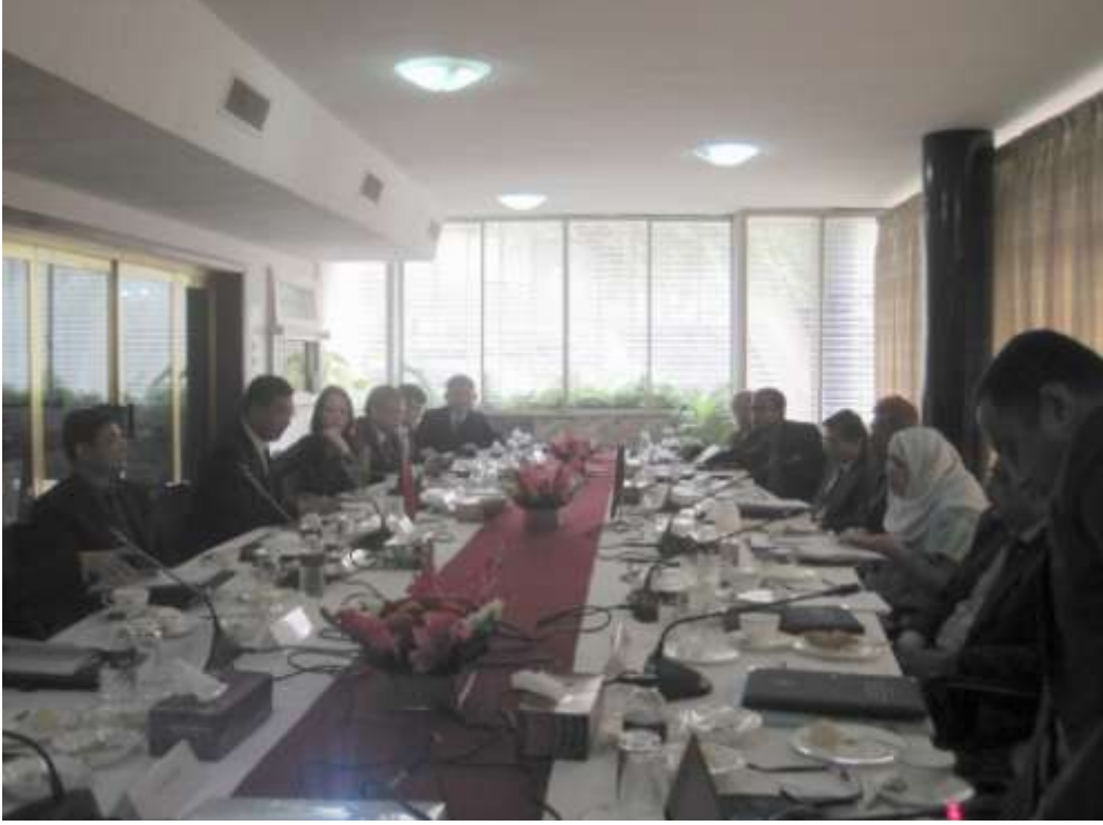
০৫-০৯ ডিসেম্বর, ২০১৫ তারিখে ঢাকায় পানি সম্পদ সহযোগিতা বিষয়ে চীনা প্রতিনিধিদলের সাথে একটি বৈঠক

এছাড়া, সদস্য যৌথ নদী কমিশন, বাংলাদেশ এর নেতৃত্বে গত ০৫-০৯ ডিসেম্বর, ২০১৫ খ্রিঃ চীনা প্রতিনিধিদলের সাথে পানি সম্পদ সহযোগিতা সম্পর্কিত একটি বৈঠক ঢাকায় অনুষ্ঠিত হয়েছে।