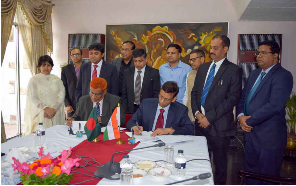
২৭ ফেব্রুয়ারি, ২০১৮ তারিখে ঢাকায় অনুষ্ঠিত ভারত-বাংলাদেশ যৌথ কমিটির ৬৮তম বৈঠক শেষে বৈঠকের সম্মত কার্যবিবরণী স্বাক্ষর