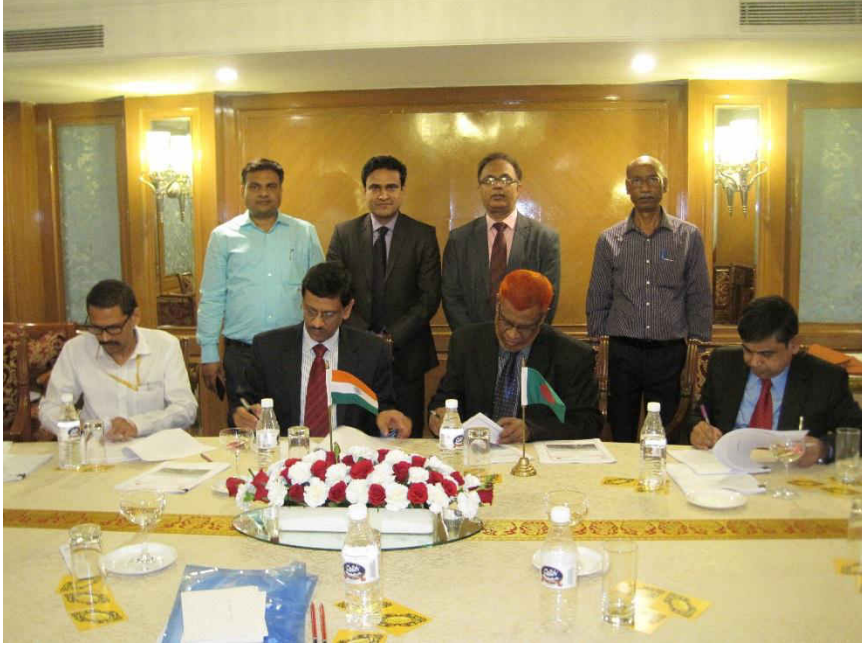
০৪ অক্টোবর, ২০১৭ তারিখ দিল্লীতে অনুষ্ঠিত ভারত-বাংলাদেশ যৌথ কমিটির ৬৭তম বৈঠকে গঙ্গা নদীর পানি বন্টন সংক্রান্ত ২০১৭ সালের বার্ষিক প্রতিবেদন স্বাক্ষর