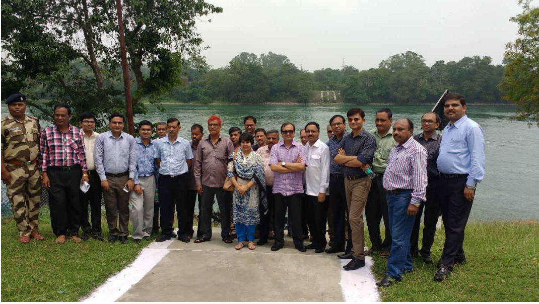
০৭ মে, ২০১৮ তারিখে ভারত-বাংলাদেশ যৌথ কমিটির প্রতিনিধিদল কর্তৃক ৬৯তম বৈঠকের পূর্বে ভারতের ফারাক্কা ব্যারাজের ফিডার ক্যানালের প্রবাহ পরিমাপ সাইট পরিদর্শন