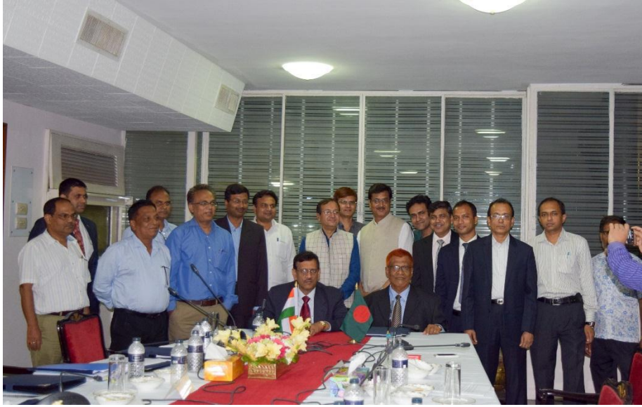
১৮ মে, ২০১৭ তারিখ ঢাকায় অনুষ্ঠিত ভারত-বাংলাদেশ যৌথ নদী কমিশনের কারিগরি পর্যায়ের বৈঠকের কার্যবিবরণী স্বাক্ষর