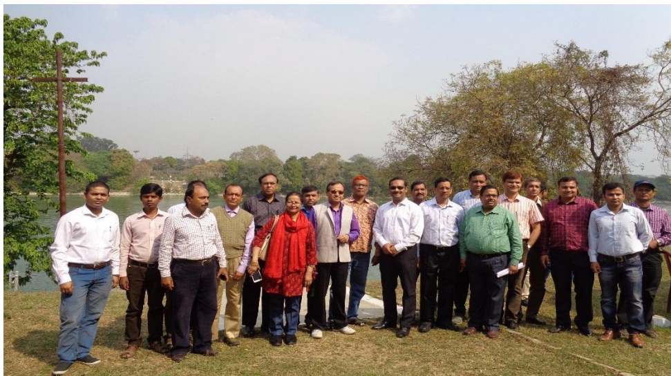
০৪ মার্চ, ২০১৭ তারিখে ভারত-বাংলাদেশ যৌথ কমিটির প্রতিনিধিদল কর্তৃক এর ৬৫তম বৈঠকের পূর্বে ভারতের ফারাক্কা ব্যারেজের ফিডার কানালের প্রবাহ পরিমাপ সাইট পরিদর্শন