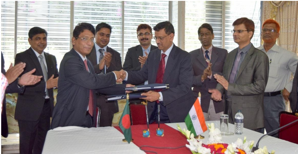
০৪ ডিসেম্বর, ২০১৬ তারিখ ঢাকায় অনুষ্ঠিত ভারত-বাংলাদেশ যৌথ কমিটির ৬৪তম বৈঠকে গঙ্গা নদীর পানি বণ্টন সংক্রান্ত ২০১৬ সালের বার্ষিক প্রতিবেদন বিনিময়

২০১৭ সালের শুষ্ক মৌসুমেও (১ জানুয়ারি থেকে ৩১ মে) চুক্তি অনুযায়ী ফারাক্কায় গঙ্গা নদীর পানি বণ্টন কার্যক্রম বাস্তবায়ন করা হয়েছে। গঙ্গা নদীর পানি বণ্টন চুক্তি বাস্তবায়নের লক্ষ্যে গঠিত বাংলাদেশ-ভারত যৌথ কমিটি কর্তৃক ২০১৭ সালের শুষ্ক মৌসুমে ফারাক্কায় যৌথ প্রবাহ পরিমাপের সাইট পরিদর্শন ও ৬৫তম সভা মার্চ, ২০১৭ মাসে কোলকাতায় এবং হার্ডিঞ্জ সেতুর নিকট যৌথ প্রবাহ পরিমাপের সাইট পরিদর্শন ও ৬৬তম সভা মে, ২০১৭ মাসে ঢাকায় অনুষ্ঠিত হয়েছে।